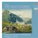
F. Mendelssohn Sinfonie Nr. 2 'Lobgesang' 2014