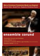
Merry Christmas Funkelnde Musik aus England Konzertaufnahme im KKL Luzern DVD 2011