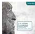
J. B. Hilber Chorwerke 2013