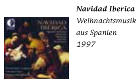
Navidad Iberica Weihnachtsmusik aus Spanien 1997