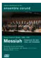
G. F. Händel Messiah Konzertaufnahme im KKL Luzern DVD 2012