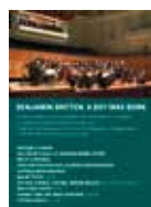
B. Britten A Boy was Born Konzertaufnahme im KKL Luzern DVD 2013