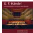
G. F. Händel Die beliebtesten Chöre aus dem Messias 2008